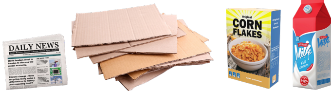
Paper, Cardboard, and Cartons Papel y Cartón